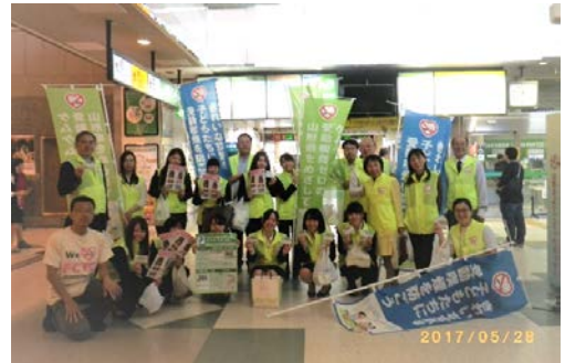
2017 年 5 月の世界禁煙デーでの啓発活動(山形駅)